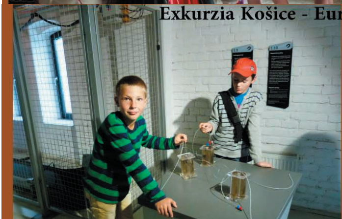
Exkurzia Košice - Európska noc výskumníkov