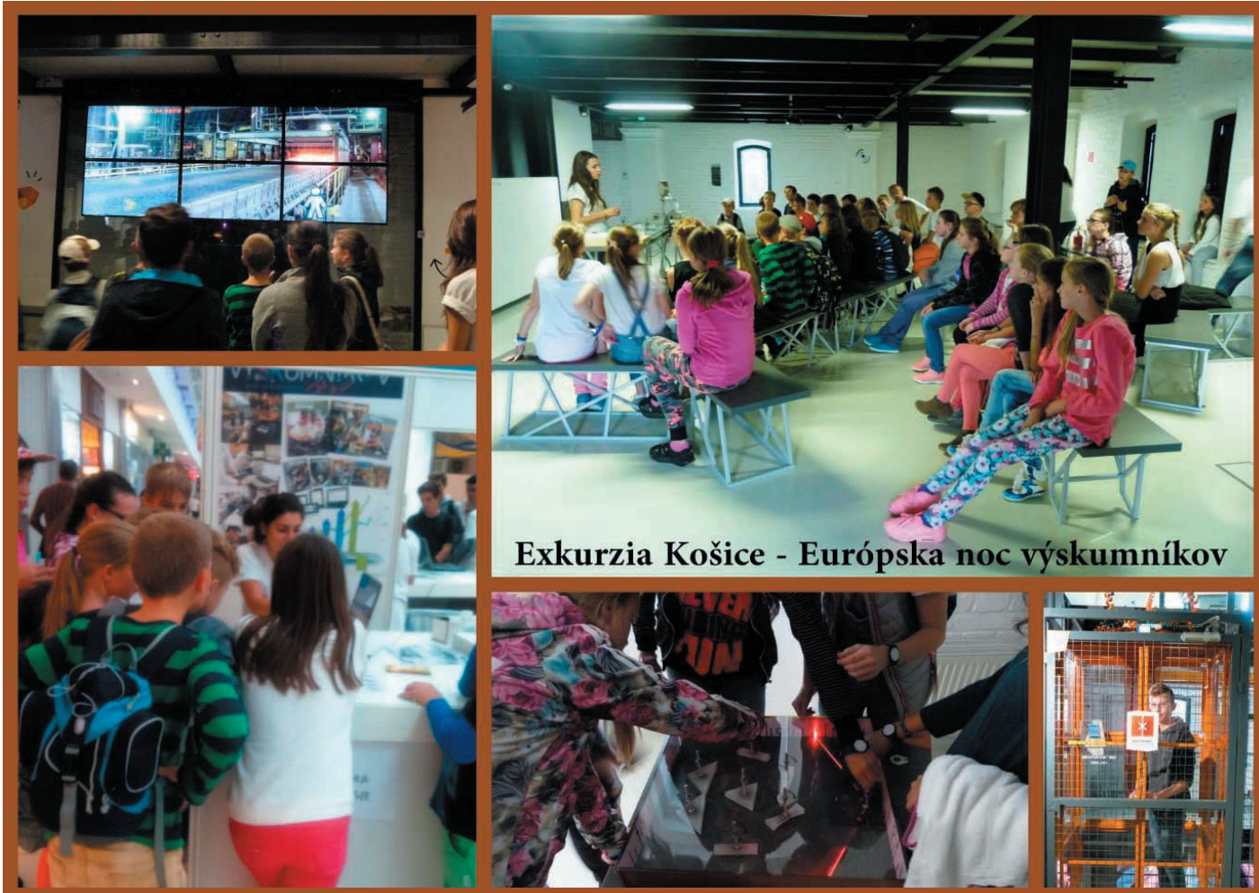
Exkurzia Košice - Európska noc výskumníkov