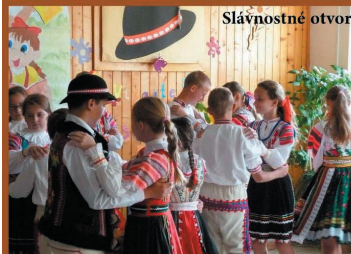
Slávnostné otvorenie školského roka