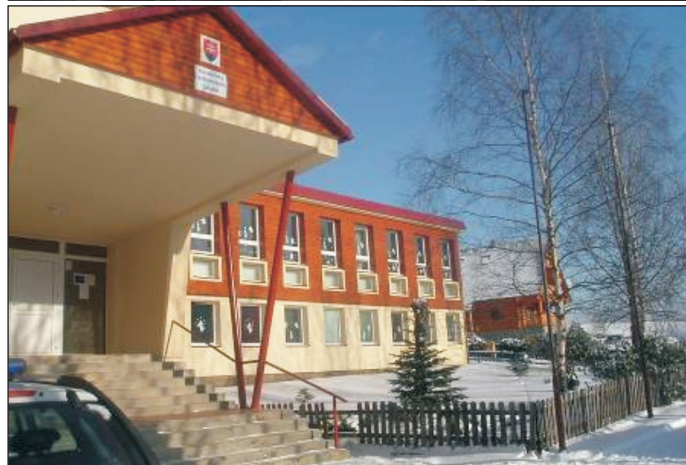
Regionálna výchova v ZŠ